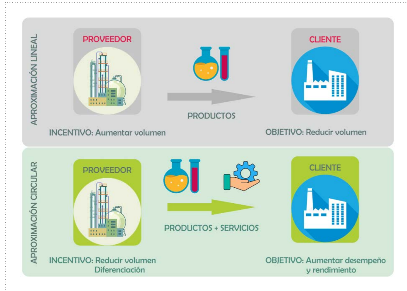
Figura 6. Aproximaciones lineal y circular de los modelos de negocio.

Una cuestión adicional, y no de importancia menor, es la referida a qué técnicas y metodologías son las más útiles para que la innovación circular tenga éxito. Las formas de relación y el intercambio de información, dentro de la misma cadena de valor, y con otras, es fundamental para obtener el éxito en los procesos de innovación. Además, en el mundo actual, la digitalización de los procesos es básica ya que permite estudiar alternativas, prever situaciones, manejar grandes cantidades de información, llevar a cabo simulaciones y otros estudios de forma previa y con elevadas probabilidades de que el resultado final sea el mejor de los posibles. Por ello se han definido un conjunto de métodos y herramientas cuya aplicación serán un importante factor de éxito para la transformación circular. Estas palancas de pensamiento son: