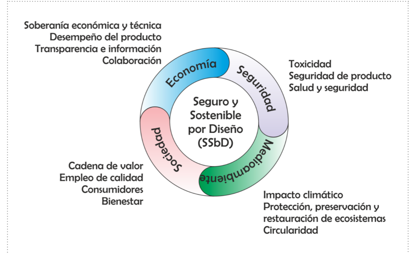
Figura 5. Dimensiones de seguridad y sostenibilidad de los productos químicos, materiales y procesos según los principios SSbD.

Cefic (2024). Safe and Sustainable-by-Design: A guidance to unleash the transformative power of innovation. Cefic, Brussels.