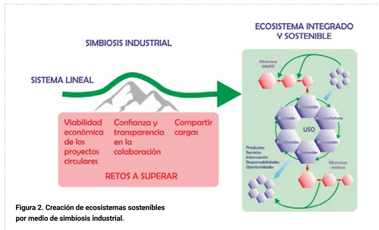
Figura 2. Creación de ecosistemas sostenibles por medio de simbiosis industrial.

como, por ejemplo, en grandes clústeres químicos. En ellos se pueden aprovechar y optimizar los flujos de materiales entre compañías para crear oportunidades de negocio nuevas.