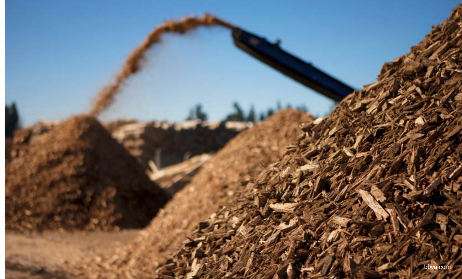
Figura 1. Situación general de la transición circular.