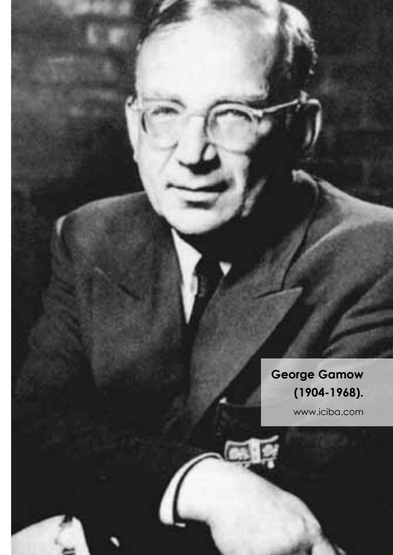
George Gamow (1904-1968).

Durante su larga estancia como profesor, en la Universidad George Washington fue donde se gestaron, con la ayuda fundamental de Ralph Alpher, los trabajos cruciales que derivarían en soporte básico para un Big Bang "caliente", así como la predicción de una radiación residual, la ahora conocida como fondo cósmico de microondas, y por cuyo descubrimiento recibieron el premio Nobel... Penzias y Wilson. Gamow aceptó a Alpher, hebreo de origen bielorruso, como doctorando, e inmediatamente lo puso a trabajar en un tema muy relevante y que sería el eje central de su tesis doctoral: el origen de los elementos químicos en el Universo. La preparación en Física Atómica de Alpher, así como su profundo conocimiento de la matemática aplicada, fueron esenciales para que él y Gamow resolvieran, junto con Robert Herman, el problema básico de la abundancia de elementos en el Universo.