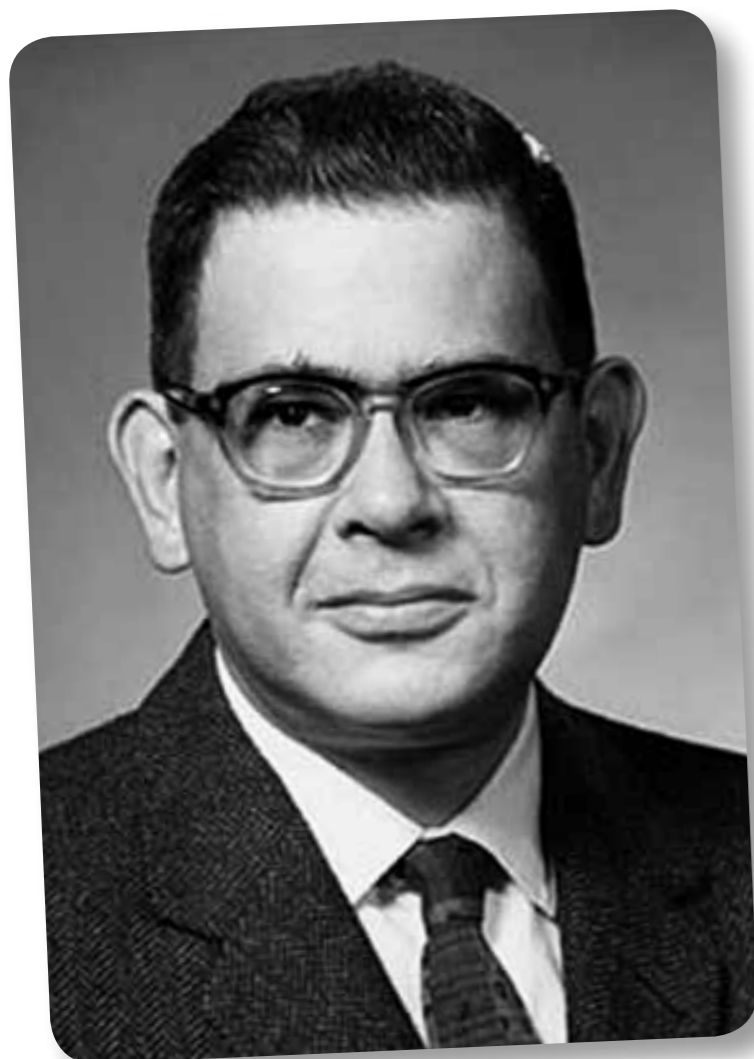
Ralph Alpher (1921-2007).