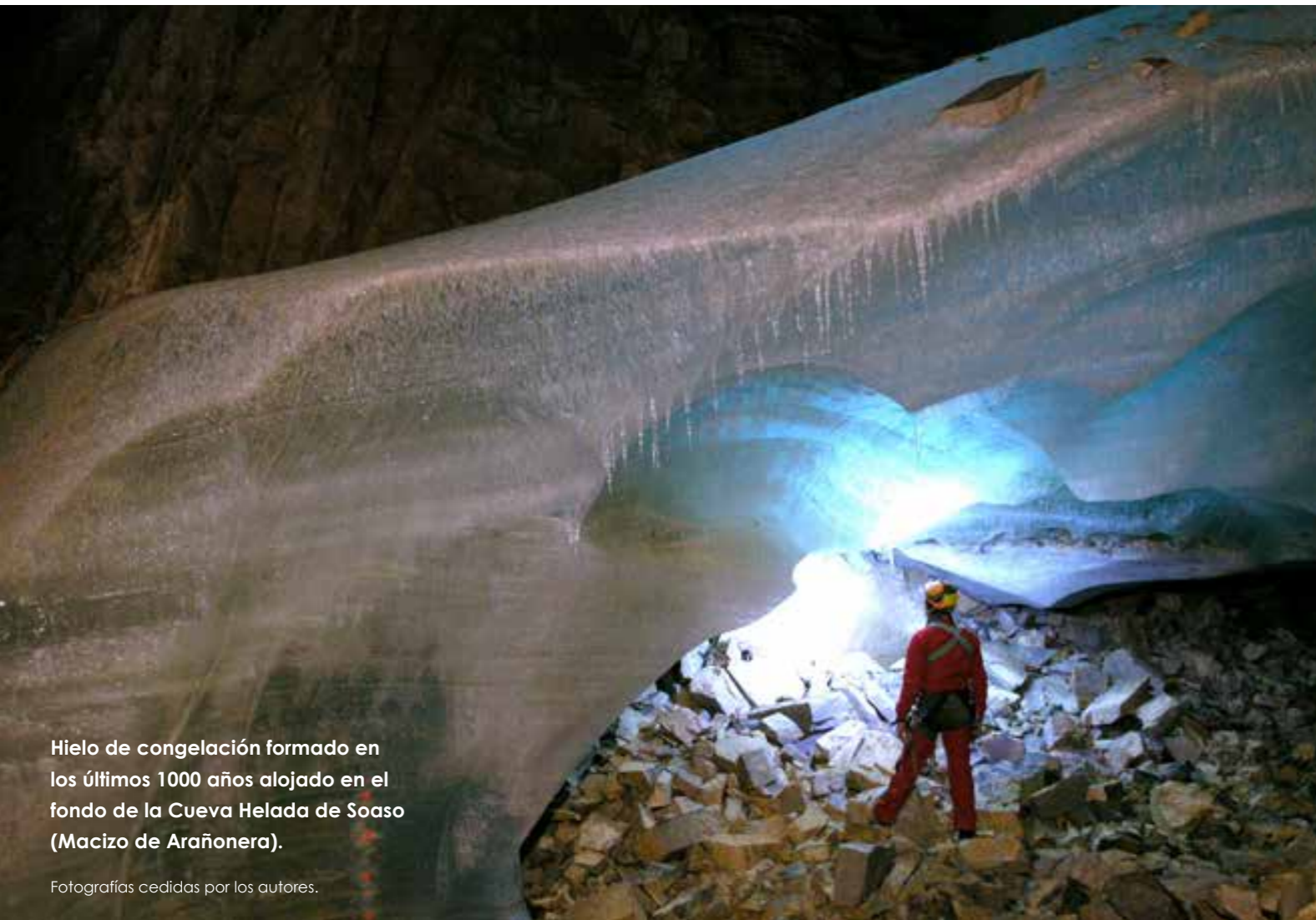
Hielo de congelación formado en los últimos 1000 años alojado en el fondo de la Cueva Helada de Soaso (Macizo de Arañonera).