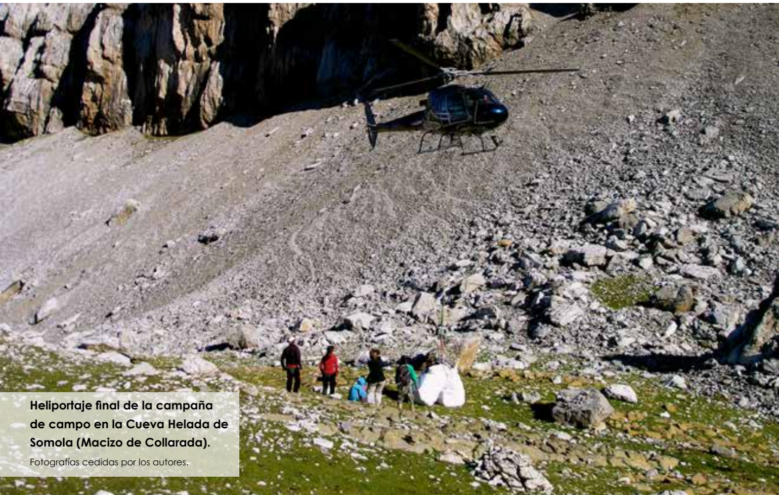
Heliportaje final de la campaña de campo en la Cueva Helada de Somola (Macizo de Collarada).