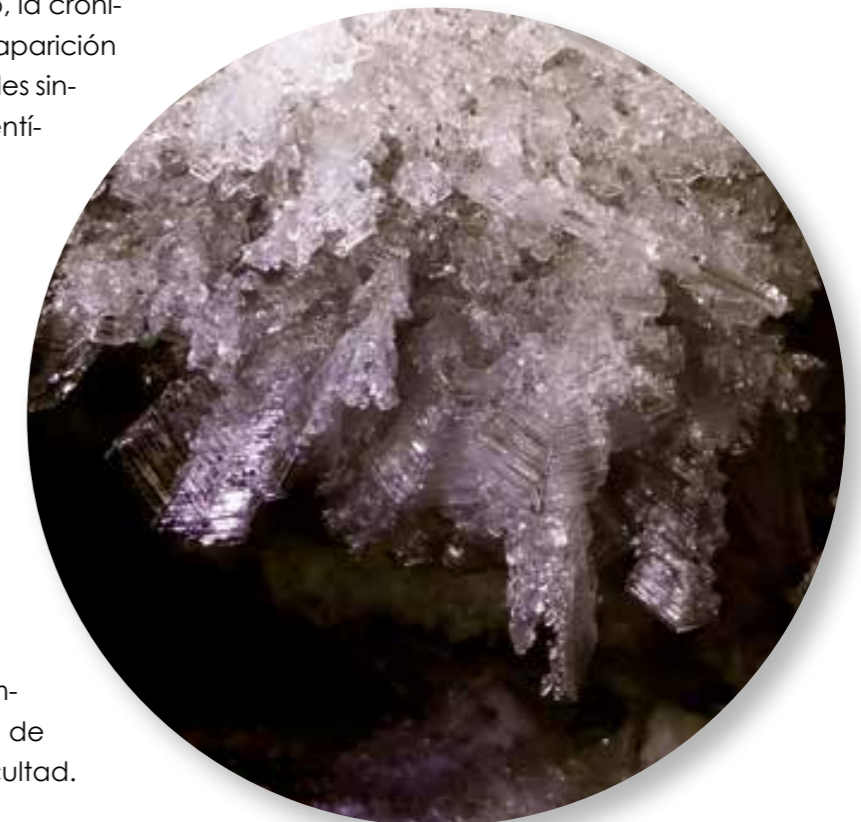
Cristales de hielo de sublimación inversa en una pared de la Cueva Helada de Sarriós-5 (Macizo de Monte Perdido).