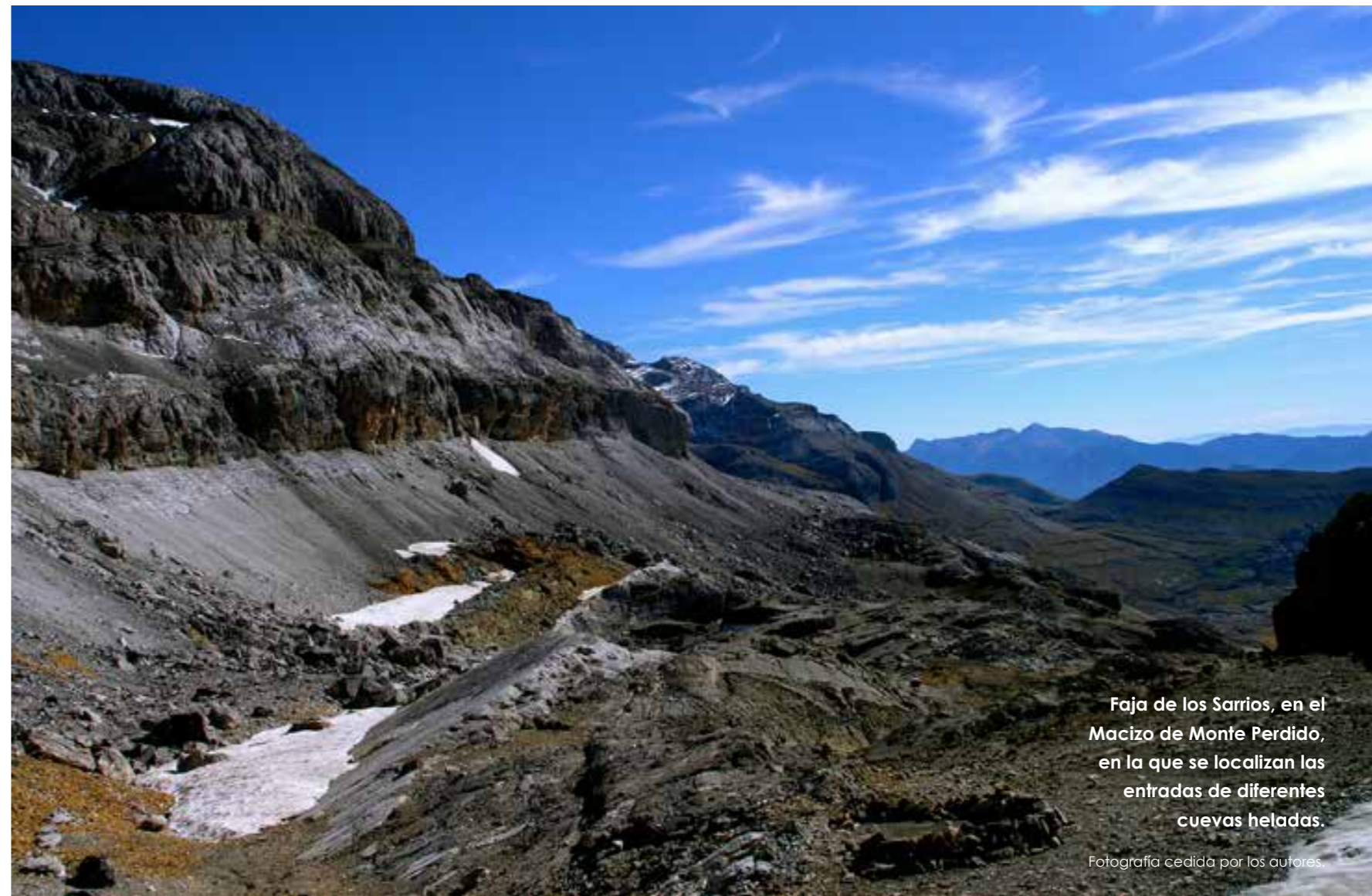
Faja de los Sarrios, en el Macizo de Monte Perdido, en la que se localizan las entradas de diferentes cuevas heladas.

“El estudio de la mítica Gruta Helada de Casteret, en el Parque Nacional de Ordesa y Monte Perdido constituye todo un desafío”.