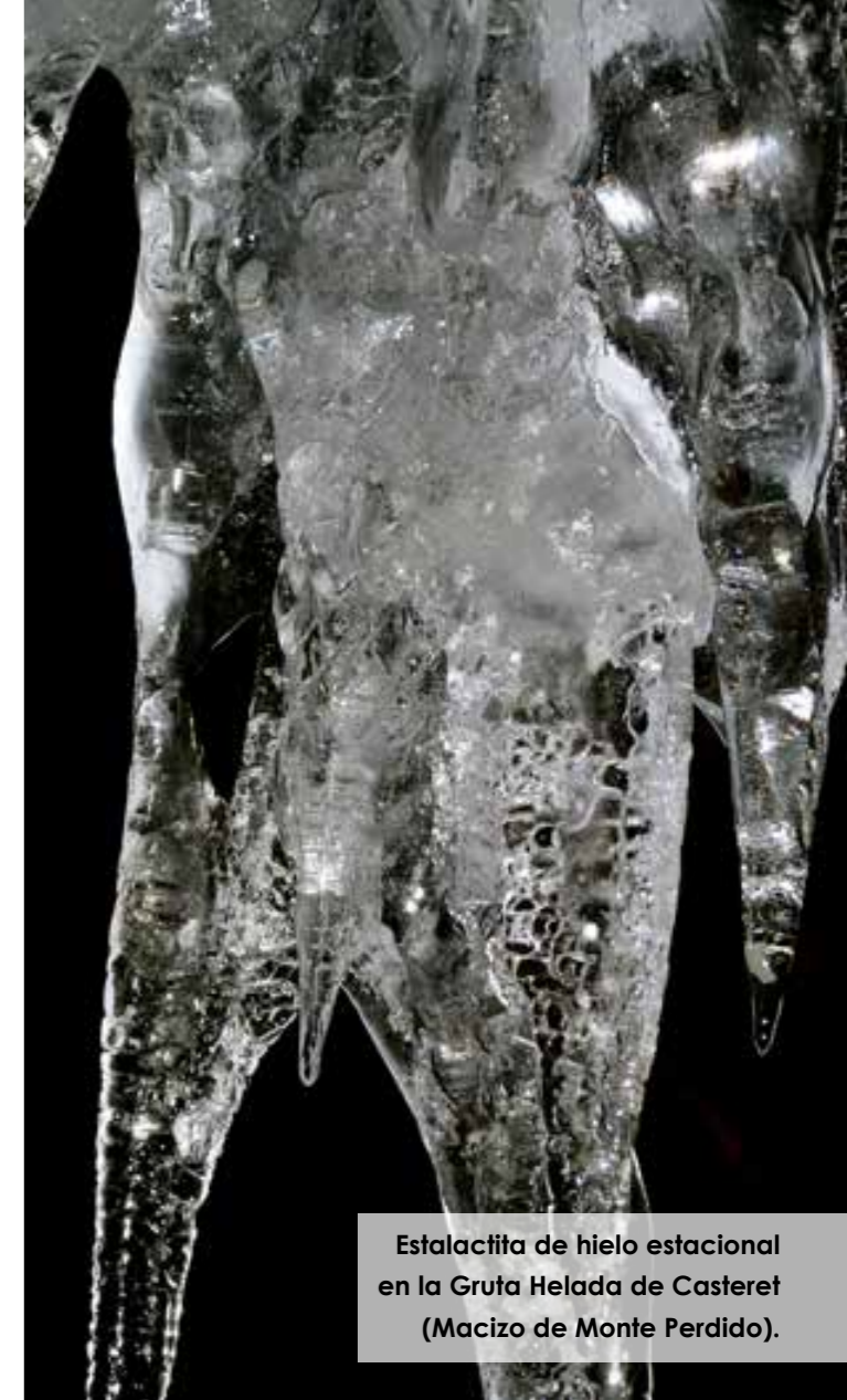
Estalactita de hielo estacional en la Gruta Helada de Casteret (Macizo de Monte Perdido).

2) Dpto. de Procesos Geoambientales y Cambio Global Instituto Pirenaico de Ecología CSIC