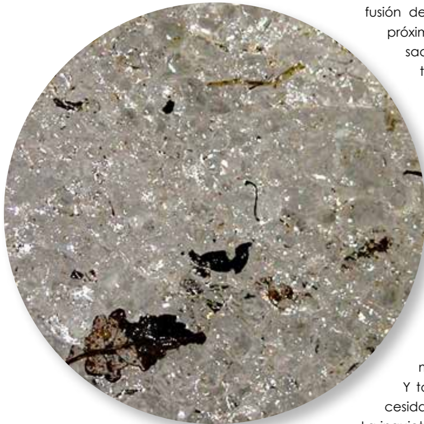
Macrorrestos vegetales (hojas, semillas, acículas, etc.) en la Cueva Helada A294 introducidos por el viento a la vez que la nieve (Macizo de Cotiella).