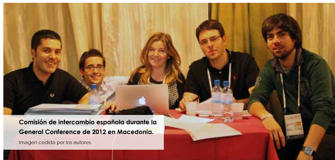
Comisión de intercambio española durante la General Conference de 2012 en Macedonia.

Pero lo que aporta IAESTE va más allá de las prácticas. Actualmente existen 5 centros diferentes en la Universidad de Zaragoza (Escuela de Ingeniería y Arquitectura, Facultad de Ve-