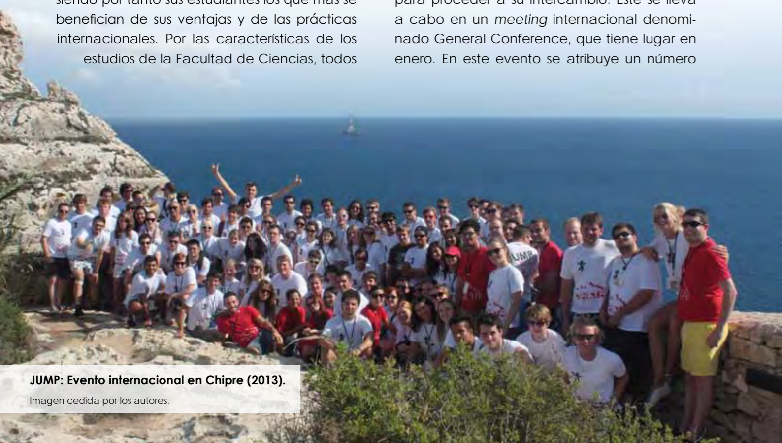
JUMP: Evento internacional en Chipre (2013).