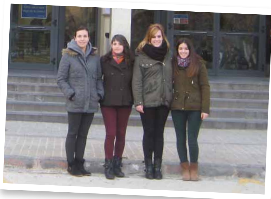
Comité de IAESTE Zaragoza en la Facultad de Ciencias.